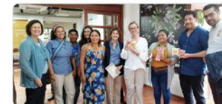
Unión Europea en Colombia y 2 más