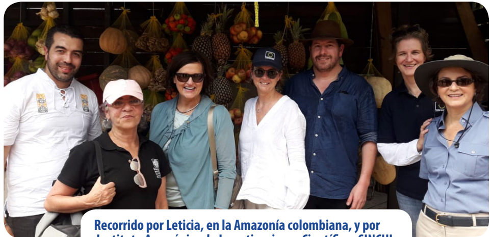
Recorrido por Leticia, en la Amazonía colombiana, y por Instituto Amazónico de Investigaciones Científicas SINCHI.

La jornada continuó con reuniones estratégicas sobre dos de los principales aportes de la Cooperación Europea en Colombia: los programas Desarrollo Local Sostenible y Desarrollo Rural con Enfoque Territorial. Los encuentros permitieron establecer metas y estrategias conjuntas con el Viceministro de Desarrollo Rural, el Jefe de la oficina de Negocios Verdes, del Ministerio de Ambiente, la Directora de Parques Nacionales Naturales y la Directora del Instituto Amazónico de Investigaciones Científicas SINCHI. Fue una oportunidad para conocer de primera mano los logros alcanzados en las Fases I de cada programa y proyectar las Fases II que permitirán fortalecer y ampliar el impacto alcanzado hasta el momento.